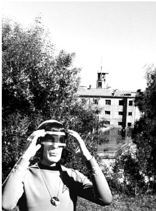
Nimoy e a Panificadora de Vigo, ao fondo

Camarada Nimoy, que toma o seu nome de Leonard Nimoy –maiormente coñecido polo seu papel